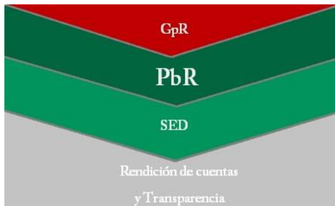
Esquema obtenido de la SHCP

El Sistema de Evaluación del Desempeño (SED) se liga con el Presupuesto basado en Resultados (PbR) en el Marco del nuevo Modelo de Gestión en base a Resultados (GbR), mismo que se está implementando en Nayarit a partir de las diversas reformas constitucionales y legales aplicadas desde el 2008 a nivel nacional.